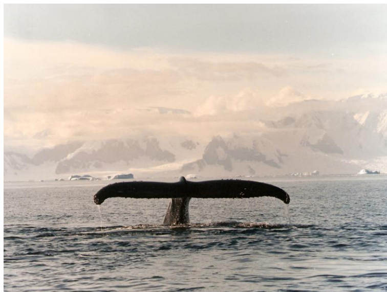
Figura 13. Nadadeira caudal de baleia-jubarte ( Megaptera novaeangliae ) na Península Antártica: uma simbologia na luta pela conservação dos oceanos.