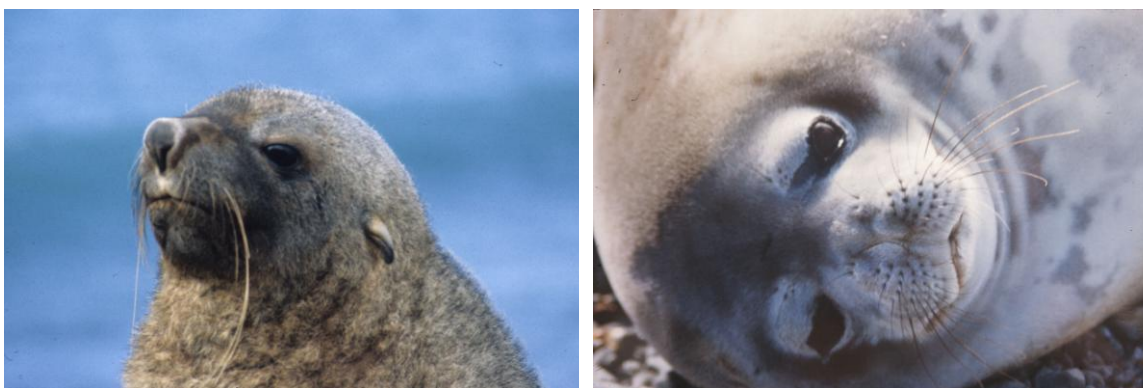
Figura 10. Outra das diferenças básicas entre um Otariidae, à esquerda, e um Phocidae, à direita. Nota-se a presença do pavilhão auditivo no exemplar de lobo-marinho-subantártico, Arctocephalus gazella , e a ausência do mesmo na foca-de-Weddel, Leptonychotes weddellii .

A família Otariidae é representada por lobos e leões-marinhos. Eram esses os artistas que povoavam circos fazendo malabarismos com bolas no passado e que eram cunhados de maneira muitíssimo equivocadas como focas. Ainda nos dias de hoje, quando a mídia comenta em malabarismos com bolas, acaba por utilizar o termo equivocado de foca. Leões marinhos são distinguidos dos lobos pela pelagem adensada que os machos adultos apresentam na região do “pescoço” que se assemelha a uma juba de leão. São 16 espécies divididas em sete gêneros, sendo o gênero Arctocephalus representado por oito espécies. Os otarídeos apoiam-se nos membros anteriores para se deslocar, têm pelagem densa, pavilhão auditivo e unhas vestigiais. Representantes dessa família são encontrados em áreas polares, subpolares, temperadas, subtropicais e tropicais.