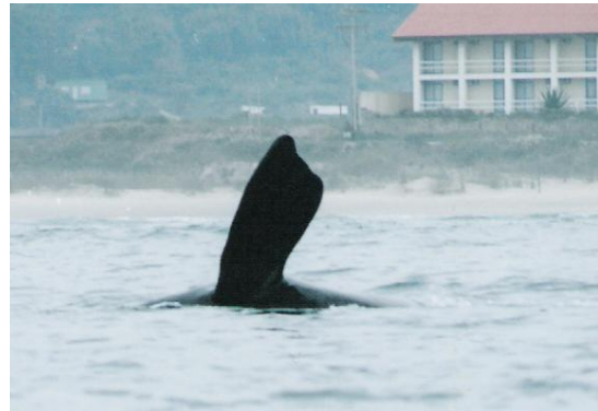
Figura 4. Baleia-franca-austral ( Eubalaena australis ) evidenciando as calosidades em sua cabeça à esquerda e a nadadeira peitoral em forma de trapézio à direita.

As outras duas famílias de mysticetos são monoespecíficas, ou seja, constituídas cada uma delas por uma espécie só e que não foi registrada na costa brasileira. A família Eschrichtiidae é representada pela baleia-cinzenta que só ocorre no oceano Pacífico, e a família Neobalaenidae é representada pela baleia-franca-pigméia, que ocorre apenas no hemisfério sul. Esta família deve ser renomeada para Cetotheriidae em função de recentes descobertas de características que a assemelham a uma família de mysticetos que havia sido considerada extinta. Os membros desta família chegam a medir 6m de comprimento quando adultos e ainda são pouco conhecidas. As baleias-cinzentas