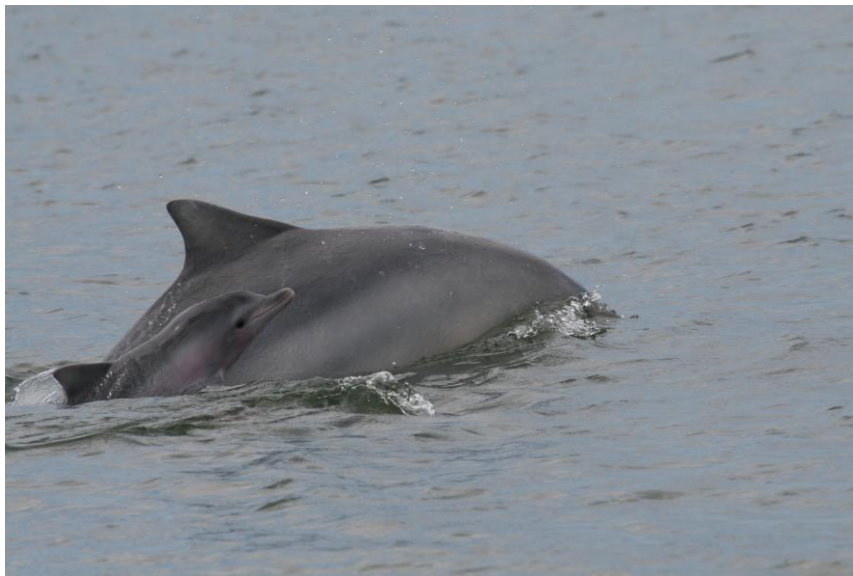
Figura 6. Par formado por fêmea e filhote de boto-cinza ( Sotalia guainensis ) no estuário de Cananéia, São Paulo.

Imbé, na divisão entre Santa Catarina e o Rio Grande do Sul, e Tramandaí, no Rio Grande do Sul. Nessa interação os golfinhos arrebanham tainhas para as águas rasas, onde pescadores aguardam com suas tarrafas, petrecho de pesca que é lançado à água e captura peixes em função de apresentar pequenas estruturas de chumbo para fazer com que a rede facilmente afunde capturando os peixes. Neste momento os golfinhos retiram a sua parte do trabalho das redes que estão sendo puxadas pelos pescadores arrastadas em contato com o substrato. No sul do Brasil, as comunidades litorâneas chamam o golfinho-nariz-de-garrafa de boto, já que o boto-cinza ali não ocorre. De Santa Catarina para o norte do Brasil, o golfinho-nariz-de-garrafa abandona um pouco a região costeira e deixa o espaço ocupado pelo boto-cinza, o que fez com que a comunidade pesqueira nessas regiões chamasse o boto-cinza de boto. Essa é uma tendência em um país com dimensões continentais como o Brasil. Os termos populares se adaptam às condições locais. Cabe a nós, cientistas e leitores, respeitar as regras locais.