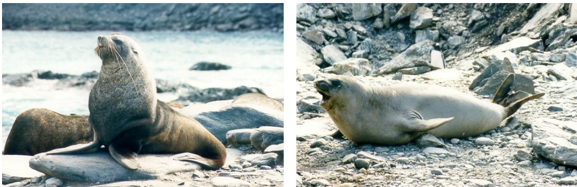
Figura 9. Uma das diferenças básicas entre um Otariidae, à esquerda, e um Phocidae, à direita. Nota-se a o apoio nos membros anteriores em substrato terrestre no exemplar de

A família Phocidae é representada pelas focas propriamente ditas. Chamamos de focas os pinípedes que rastejam sobre o substrato terrestre para locomoverem-se. São 19 espécies que apresentam pelagem curta e não apresentam pavilhão auditivo. Têm distribuição concentrada nas áreas polares e subpolares. É a família que maior sucesso alcançou entre os pinípedes, não só em número de espécies, mas também em adensamentos populacionais. Ela representa 90% dos pinípedes vivos, sendo os 10% remanescentes divididos pelas famílias Odobenidae e Otariidae. A família é representada por 13 gêneros, sendo nove monoespecíficos. Aqui se destacam o elefante-marinho ( Mirounga leonina ) pelo seu porte e potencial de navegação e mergulho, e a foca-leopardo ( Hydrurga leptonyx ) por alimentar-se de animais de sangue quente. Nesta família que se encontram os extremos de tamanho e peso nos pinípedes mencionado anteriormente. A maior parte das espécies se encontra nos polos norte e sul, sendo que há representantes encontrados no Mediterrâneo (foca-monge-do-Mediterrâneo; Monachus monachus ) e no Haváí (foca-monge-do-Haváí; Monachus shauinslandi ).