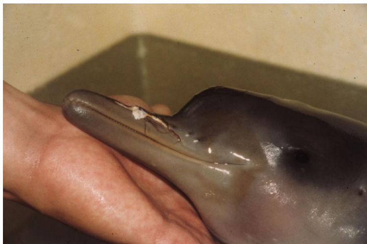
Figura 12. Filhote de toninha ( Pontoporia blainvillei ) após atropelamento por embarcação no litoral norte do Estado de São Paulo. Notar machucado gerado pela hélice no rosto, e marcas indicativas da presença do pelo comum em filhotes nas primeiras semanas de vida.

Depois de estarmos cientes de tudo isso, continuamos a pensar em aumentar o Produto Interno Bruto das nações a todo custo, doa a quem doer, desapareçam as espécies que tenham que desaparecer. Contentemo-nos com uma fauna pobre, composta por pombos, pardais, bagres, e liquidemos toda a beleza que a evolução nos presenteou. Liquidemos a nós mesmos! Esse é o caminho que estamos traçando. Se quisermos mudar esse rumo, temos que começar já. Temos que investir em mudança de hábitos. Para a espécie humana, esse será o desafio do século XXI. Se não mudarmos nossos hábitos, estaremos sujeitos a viver em um mundo contaminado, repleto de pragas e doenças, com praticamente nenhuma qualidade de vida.