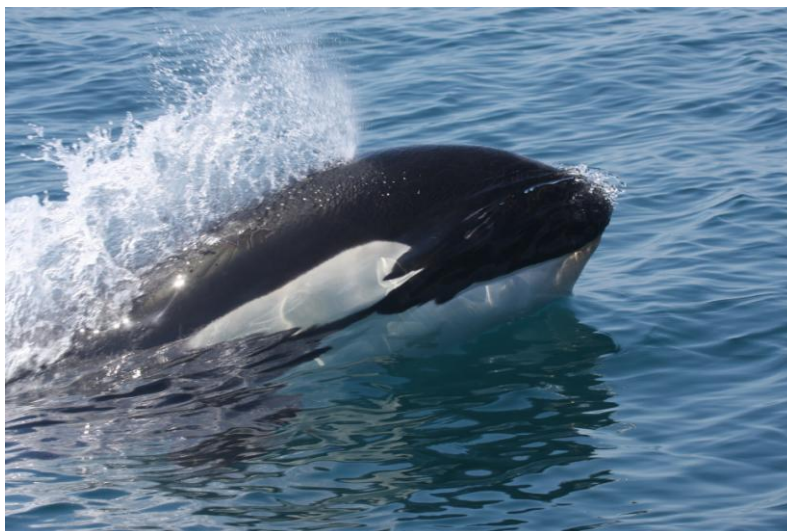
Figura 5. Exemplar de orca ( Orcinus orca ) avistado ao largo de Ilhabela, São Paulo, em dezembro de 2012.