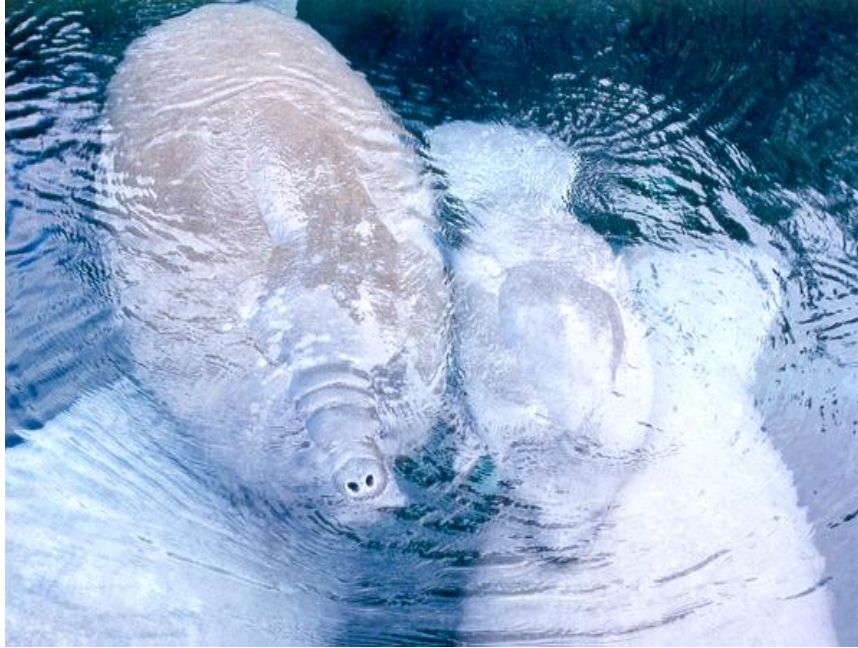
Figura 8. Peixe-boi-marinho ( Thichechus manatus ) evidenciando o momento de trocas gasosas com o ambiente aéreo.

Algumas características morfológicas dos sirênios são muito interessantes. Por exemplo, como se tratam de pastadores, seus dentes são adaptados para este hábito alimentar. Eles apresentam de cinco a sete dentes funcionais por ramo mandibular e maxilar, e esses dentes apresentam crescimento contínuo, sendo gastos com o tempo. Apenas o dugongo tem um par de dentes incisivos que serve para cortar vegetais associados ao fundo além de Ascideas e poliquetos. Outra característica morfológica interessante se concentra no posicionamento das duas glândulas mamárias nas fêmeas, situadas abaixo da nadadeira peitoral. O período de gestação dura entre 12 e 14 meses e os sirênios podem gerar e criar gêmeos. Assim como os cetáceos, os sirênios são promíscuos, ocorrendo cópula da fêmea com muitos machos em uma estação reprodutiva.