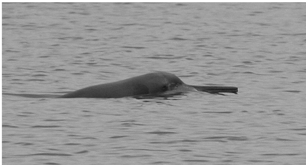
Figura 7. Toninha fotografada na Baía das Laranjeiras, norte do Paraná no ano de 2008, quando uma população foi descrita pela primeira vez para as águas estuarinas locais.

única representante da família Pontoporiidae. Muitíssimo arisca com relação à aproximação de humanos, a toninha tem preferência por ocorrer em águas costeiras, rasas e turvas. Há duas regiões estuarinas onde podem ser encontradas no Brasil: a baía de Babitonga em Santa Catarina e a Baía das Laranjeiras no norte do Paraná.