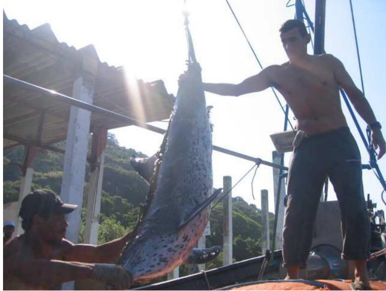
Figura 11. Golfinho-pintado-do-Atlântico ( Stenella frontalis ) acidentalmente capturado em redes de pesca no sudeste do Brasil.