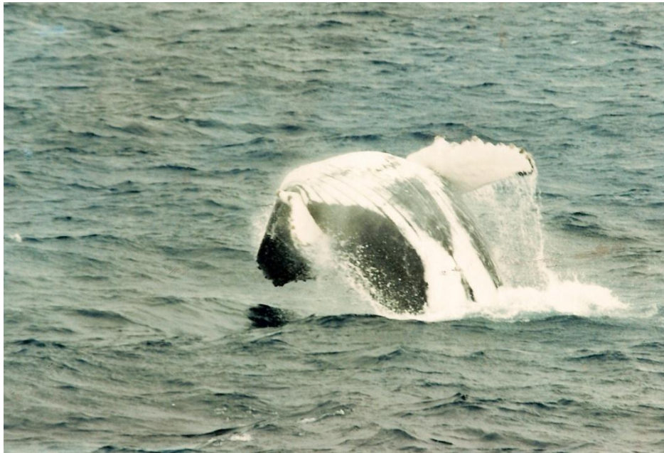
Figura 3. Baleia-jubarte ( Megaptera novaeangliae ) saltando à frente de uma embarcação e mostrando suas imensas nadadeiras peitorais.

novaengliae , que significa “asas imensas da Nova Inglaterra” (do latim, mega = imenso + pterus = asa).